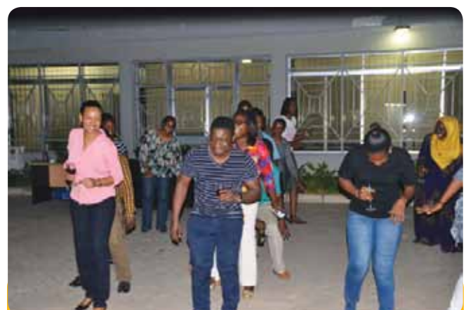
Ngoma maalum ya Kwaito ikichezwa nabaadhi ya wafanyakazi wa FCS waliohudhuria hafla hiyo.