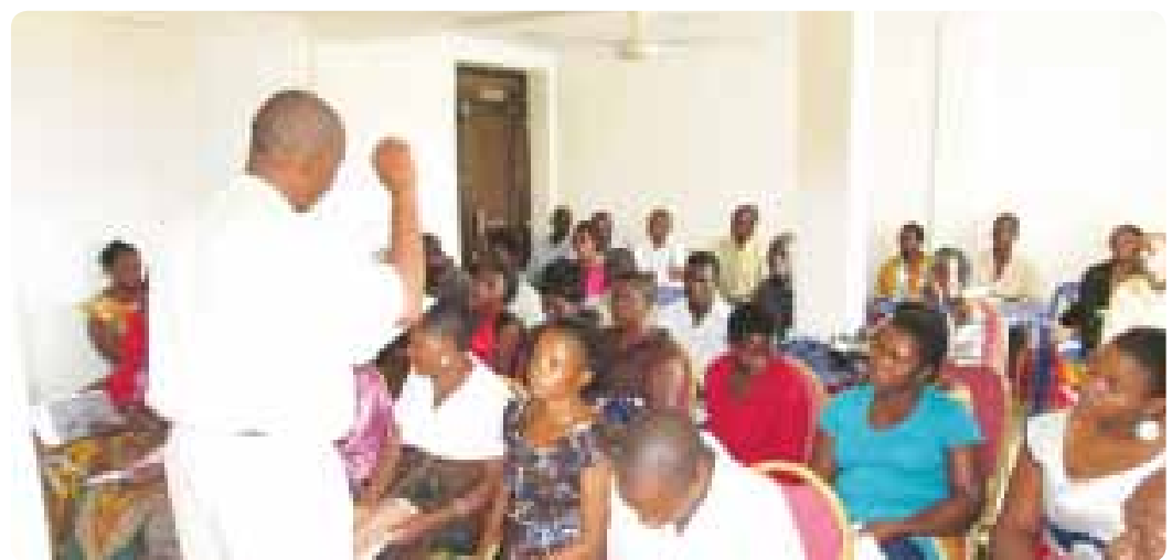
Mwezeshaji anawafundisha vijana umuhimu wa kuunda majukwaa ya vijana. Tukio hili lilifanyika Mbeya, nalo liliandaliwa na MHNT.

Mwashilindi anasema kwamba jukumu lao kubwa kama asasi ya kiraia ni kuwasaidia vijana kuanzisha vikundi ambavyo