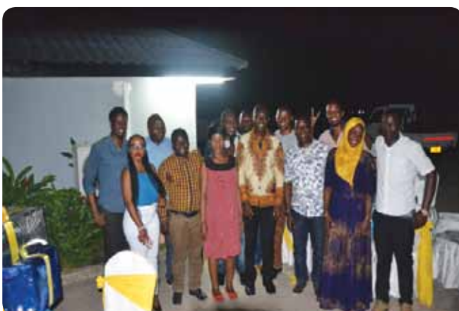
Picha ya pamoja ya baadhi ya wafanyakazi wa FCS na wale wanaoondoka.