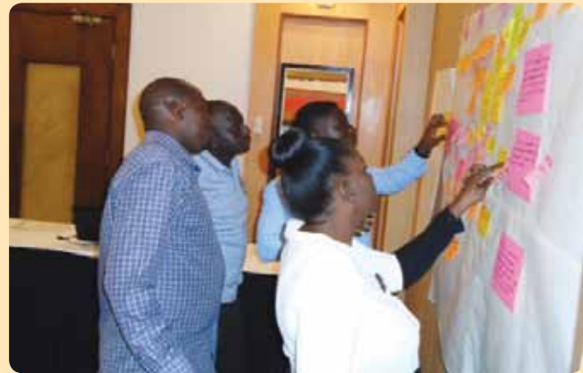
Wajumbe wa Bodi ya FCS, Washirika wa Maendeleo, Timu ya Uongozi na Washiriki kutoka asasi mbalimbali wakihudhuria warsha katika hoteli ya Ledger Plaza Bahari Beach, mwanzoni mwa mwaka huu. Warsha hiyo ilirekebisha Dhana ya Mabadiliko ya FCS na kubainisha njia za kuifikia.