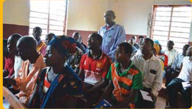
Washiriki wakifuatilia mafunzo kuhusu upatikanaji wa haki za ardhi iliyoandaliwa na MVIWATA

K wenye nchi ambayo karibu kasilimia 80 ya wananchi wanategemea kilimo kama njia ya kipato, ujuzi wa sera na sheria unahitajika kupewa kipaumbele kwenye mipango ya taifa.