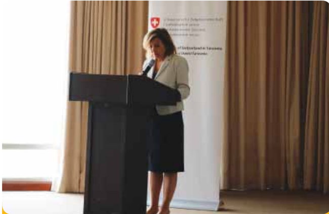
Balozi wa Uswisi nchini Tanzania, Mheshimiwa Frolence Mattli, akitoa hotuba yake ya ufunguzi katika hafla hiyo.

nchini Tanzania hukutanisha Azaki mbalimbali zinazopata ufadhili kutoka shirika la SDC zilizopo nchini Tanzania. Mada iliyojadiliwa katika tamasha la mwaka huu ilihusu namna Azaki zinavyojihusisha na suala la jinsia; ambapo kila asasi iliyoshiriki ilitakiwa kuelezea mafanikio yake na changamoto za kiutendaji katika suala hilo.