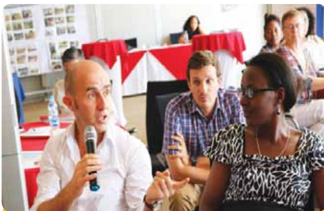
Mwakilishi kutoka BBC nchini Tanzania akizungumza wakati wa hafla hiyo